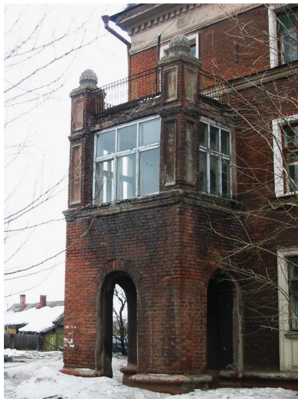
Рис. 9. Омск, ул. Б. Хмельницкого. Фрагмент фасада жилого дома. «Шишки-вазоны» на парапетах балкона. Нач. 1950-х.

В заключение следует отметить, что в период нарастающей урбанизации и, порой, неизбежных утрат художественного наследия, представленные материалы позволяют дополнить и углубить локальные исследования в области региональной архи-