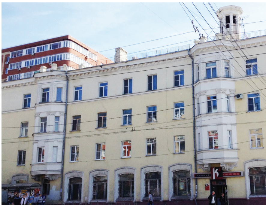
Рис. 7. Омск, ул. 10 лет Октября, 48. Жилой дом с книжным магазином. 1950-е. 2017 г.

манской улице, где размещалась частная гимназия М. В. Каёш, (современная ул. Ленина, 36) (рис. 5). Учебное заведение было основано в 1914 году, и эту дату некоторые источники указывают как год строительства рассматриваемого здания [8]. Однако владелица гимназии Мария Каёш с 1914 по 1916 год арендовала дом на улице Станичной, 10, и только после возведения здания на близлежащей Атаманской улице переехала в новые помещения. С точки зрения объемно-планировочного решения, здание могло функционировать как торговое заведение, — об этом говорят большие окна-витрины первого этажа, изначально выполненные по проекту и позднее за ненадобностью заложенные. Существует также ошибочное мнение, что здание было возведено в два этажа и надстроено еще одним в 1930-годы. Тем не менее брандмауэр трехэтажного объема со всей очевидностью демонстрирует единство кладки стеновой поверхности, уже не говоря о целостности стилевого и художественно-образного решения главного фасада. Отметим, что фасад выполнен с явным западноевропейским оттенком. Именно обработка стен штукатуркой серого цвета с имитацией каменной кладки, традиционной для