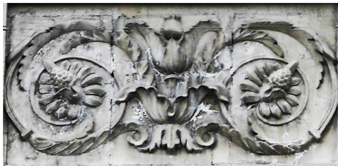
Рис. 6. Омск. Здание бывшей частной гимназии М.В. Каёш. Барельеф фасада с мотивом «сибирской шишки». 1916 г. 2009 г.