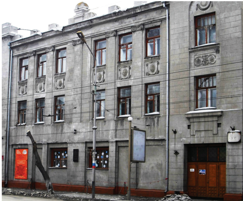
Рис. 5. Омск, ул. Ленина, 36. Здание бывшей частной гимназии М.В. Каёш. 1916 г. Фото Т. Садуовой. 2009 г.

сибирских центров, получил статус города в 1903 году, когда торгово-экономические и культурные коммуникации региона находились в состоянии активного роста благодаря Транссибирской железнодорожной магистрали. Новониколаевск был местом интенсивного обмена информацией, в том числе художественной, значительной частью которой являлись существующие в регионе локальные традиции домовой резьбы. Резной декор бурно развивающегося города как бы подытожил весь опыт народных мастеров, сложившийся к началу XX века — от техники исполнения резьбы до мотивов и элементов орнамента.