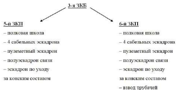
Рис. 1. Организационно-штатная структура 3-й запасной кавалерийской бригады (ЗКБ) в составе 5-го и 6-го запасных конных полков (ЗКП)