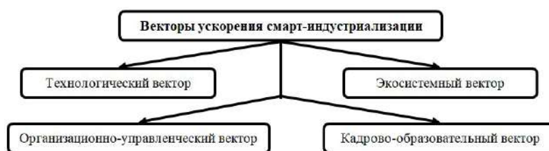
Рис. 1. Векторы ускорения смарт-индустриализации предприятия

Составлено автором Compiled by the author