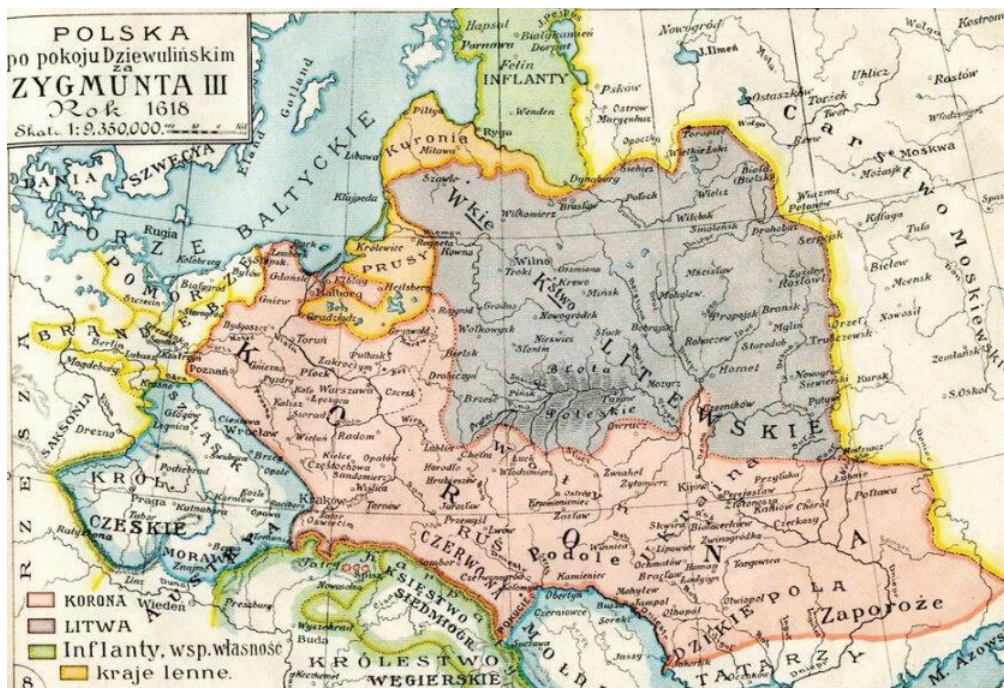
Рис. 1. Речь Посполитая в первой половине XVII в.

Сигизмунда III, также подчёркивающая полиэтничный характер государства (рис. 1).