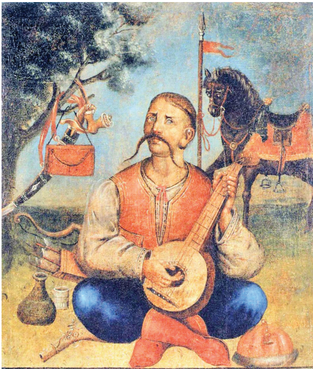
Рис. 2. Образцовый казак-украинец — покоритель Сибири