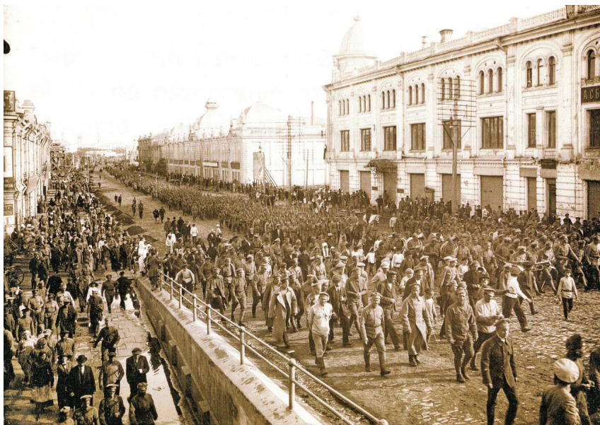
Рис. 1. Вступление Чехословацкого корпуса в Омск

Обратимся к воспоминаниям. «Когда работал механиком, — рассказывал Броз Тито, — я не терял связи с рабочими. Мне нужен был мазут, а рабочие на станции в Омске продавали его из-под полы. Вот под таким предлогом я часто наведывался в город, встречался с железнодорожными рабочими. Был в курсе всех событий. Помню, как в конце 1918 г. восстали омские рабочие. Их подавляли казаки. Руководителей расстреливали. Одного рабочего, по имени Саша (фамилию его я забыл), тоже расстреливали. Но его только ранили, и ночью крестьяне вытащили его из могилы. Он потом у меня до конца войны прятался, кочегаром на мельнице работал. Никто не хотел воевать. Крестьяне убегали, прятались. Даже я прятал несколько человек.