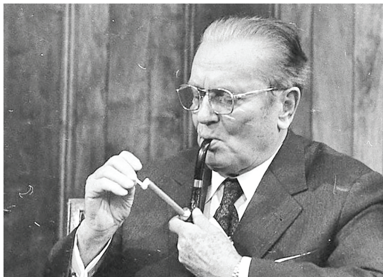
Рис. 5. Иосип Броз Тито. 1960-е гг.