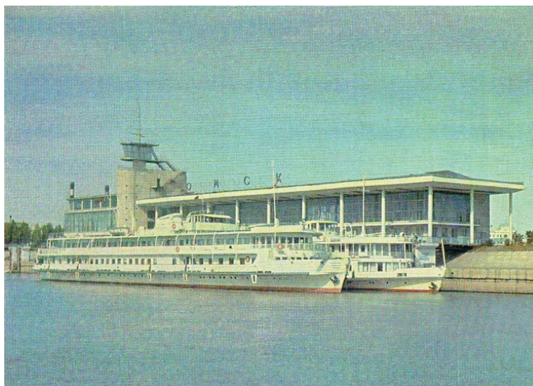
Рис. 4. Речной вокзал г. Омска. 1960-е гг.

свободы в распоряжении последней в целях стимулирования труда работников. Разработка реформы осуществлялась в 1963 – 1965 гг. под руководством Е. Г. Либермана. Обращение к экономической истории области позволяет ставить вопрос о «пилотной» апробации реформ в Омской области [8].