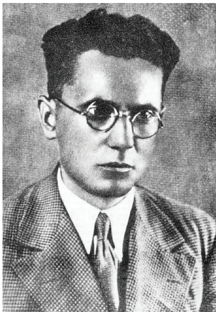
Рис. 2. Иосип Брозович. 1920-е гг.

Казаки приходили, спрашивали у крестьян, где их сыновья, и пороли... Точно так же у нас в Югославии поступали четники. В Омск я вернулся уже зимой 1919–1920 г., когда туда пришли большевики (рис. 2). Там секретарем обкома был товарищ, которого я, между прочим, в прошлом году здесь встретил. Он теперь стал ученым. Приезжал к нам, в Югославию, с делегацией инженеров-электриков. Его зовут Петр Иванович Воеводин. Интересная была встреча!.. А в 1920 г., в августе, вернулся в Югославию» [4, с. 8, 7]. На этом история пребывания будущего бессменного лидера социалистической Югославии в революционной России и г. Омске заканчивается.