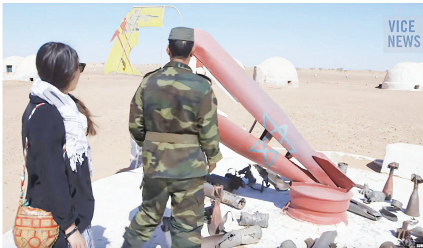
Рис. 4. Кадр из фильма «Забывтая война Сахары» (The Sahara's Forgotten War), демонстрирующий памятник, посвящённый войне между Марокко и САДР.

находится пост быстрого реагирования (район сосредоточения техники), включающий поддержку подвижных сил (танков, САУ и т.д.). Оборонительная линия подкреплена рядом неподвижных и мобильных радаров с диапазоном от 60 до 80 км, предназначенных для контрбатареинной борьбы. Большая часть марокканской самоходной и буксируемой артиллерии сосредоточена на «Берме». Строительство оборонительной линии вкупе с развитием авиации и артиллерии вынудило Фронт ПОЛИСАРИО отойти дальше в пустыню, отказавшись от контроля и даже беспокоящих ударов в зоне экономических интересов Марокко. Необходимо отметить, что еще в марте 1980 г. король Марокко Хасан II посетил оккупированную Западную Сахару и пообещал местным жителям, готовым принять власть Марокко, равные с марокканцами права и возможности. Параллельно правительство Марокко инициировало политику переселения бедных марокканцев в города Западной Сахары, чтобы повысить лояльность местного населения за счет переселенцев, которым были обещаны государственная помощь и продовольственные пайки [19; 16; 7; 23, с. 39, 50, 83, 97; 26, с. 45–46, 59, 104; 13; 25, с. 111–113].