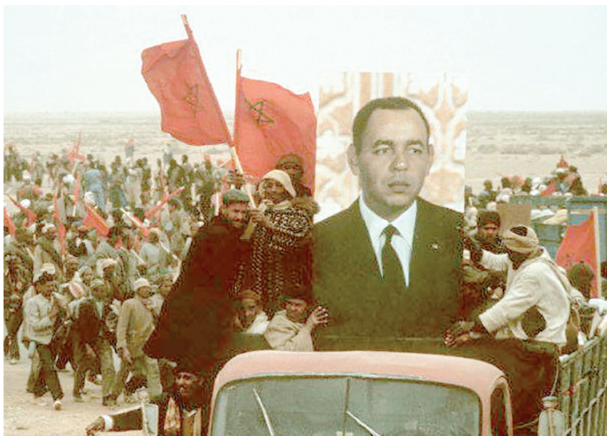
Рис. 1. «Зеленый Марш». На автомобиле закреплен портрет короля Марокко Хасана II.