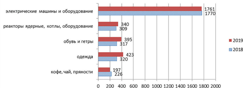
Рис. 3. Динамика импорта основных товарных позиций России из Вьетнама за 2018–2019 гг., млн долл.

Источник: составлено авторами по данным https://russian-trade.com [18]