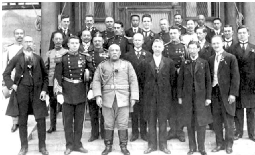
Рис. 1. Юань Шикай с американским посланником в связи с признанием США Китайской Республики. 2 мая 1913 г.