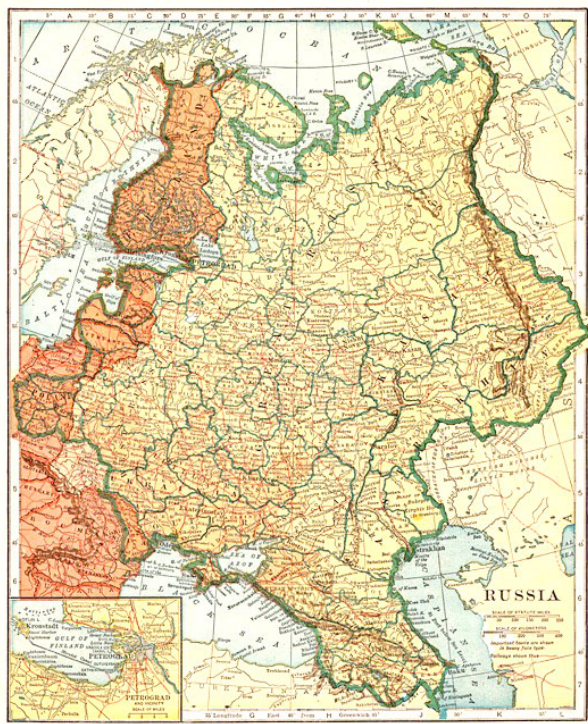
Рис. 3. Изданная на Западе карта России во время Гражданской войны 1918–1922 гг. (источник: https://oldgravura.ru/uploads/prod/prod_58c977fe49af2.jpg )

нопленных и политических заключенных. Одним из важных пунктов соглашения было признание московским и всеми другими существовавшими в России правительствами долгов бывшей Российской империи» [28, с. 117].