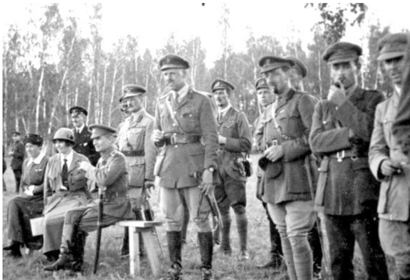
Рис. 4. На футбольном матче. Верховный Правитель А. В. Колчак и А. В. Тимирева (сидят). Рядом с Тимиревой, скорее всего, жена генерала А. Н. Гришина-Алмазова. Позади адмирала стоит генерал Альфред Нокс, в центре (справа у скамейки) – служивший при английском генерале полковник Павел Павлович Родзянко с группой офицеров Британской военной миссии. Омск. Весна 1919 г.

ной 1919 г. [9, с. 34] (рис. 4). Данное фото хорошо известно. Вопрос один: понимал ли А. В. Колчак свое положение в качестве «верховного» при «союзниках» и осознавал ли неизбежность поражения в случае их ухода?