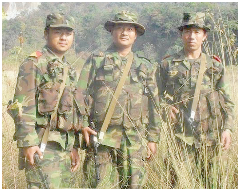
Рис. 4. Бойцы Королевской армии Бутана.