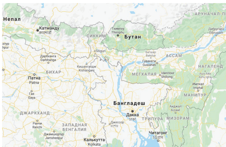
Рис. 2. Карта региона.

Англичане закрепились в Ассаме, постепенно расширяя территорию, в результате чего был образован большой штат «Бенгалия и Ассам», включающий в себя территории современных Бангладеш, Западной Бенгалия и северо-восточной Индии. Когда в 1947 г. Индия обрела независимость, Ассам стал большим штатом, объединяющим северо-восточные районы Индии (рис. 2). Штат Ассам оказался крайне нестабильным образованием, в нём действовали многочисленные повстанческие группы, национально-освободительные движения, сепаратистские движения от умеренных до радикальных и террористических [8].