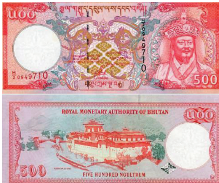
Рис. 3. Бутанский нгултрум.