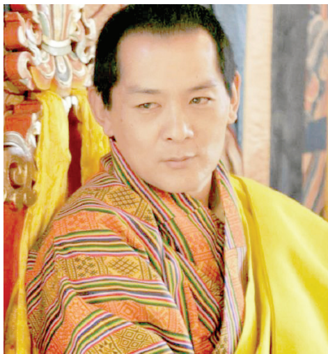
Рис. 5. Джигме Сингье Вангчук. 4-й Король-Дракон Бутана 1972–2006 гг.

пальского населения увеличилась. Распределение власти в Государственном собрании не отражало реальную картину, и популярность чогьяла (монарха), Палден Тондуп Намгьяла, падала. В 1973 г. у дворца прошли демонстрации, после которых было подписано новое соглашение, предусматривающее всеобщие выборы в Государственное собрание. Выборы прошли в апреле 1974 г. А 3 июля 1974 г. была принята конституция, по которой власть чогьяла была ограничена. В 1975 г. премьер-министр Сиккима Кази Лхендуп Дорджи Кхангсарпа, находившийся в оппозиции чогьялу, обратился к парламенту Индии с просьбой о преобразовании Сиккима в штат Индии. В апреле 1975 г. индийские войска вошли в княжество, установили контроль в столице Гангток, разоружили охрану чогьяла. Был проведён референдум, на котором 97,5 % проголосовавших (при явке в 59 %) высказались за присоединение к Индии. 16 мая 1975 г. Сикким стал 22-м штатом Индии [12].