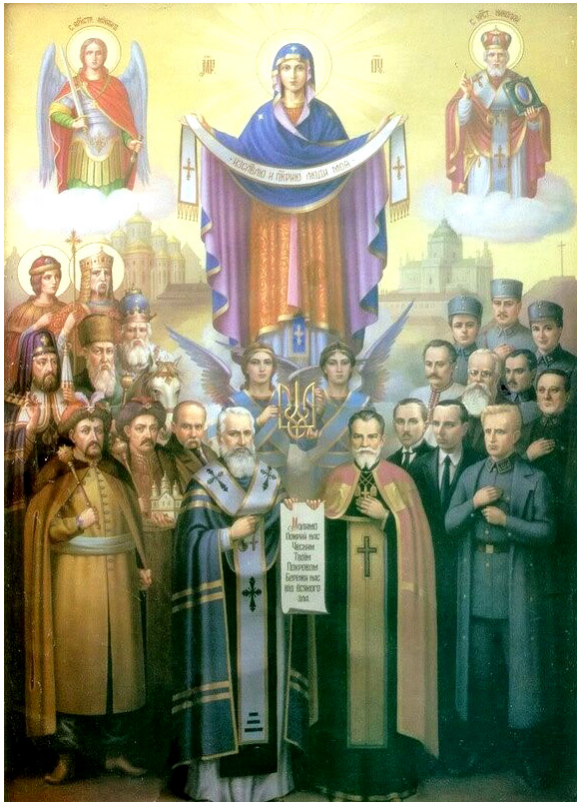
Рис. 1. Икона Покрова Божией Матери («Икона Покрови Божої Матері») [8]

стами, рассчитывая на покровительство со стороны Гитлера в отношении их деятельности по «расширению» униатской греко-католической церкви не только на всю Украину, но и «на всю Россию!» Причем этот замысел явно был одобрен руководством Римско-католической церкви» [4, с. 52]. В данном смысле этот пассаж соотносится с общей политической линией украинских националистов, распространявших свое влияние далеко за пределы Украины в регионы, населенные украинцами, оказавшимися вдали от родины [5–6].