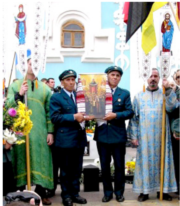
Рис. 3. Панихида по Степану Бандере в годовщину его гибели с участием ветеранов УПА. Киев. 15 октября 2010 г. [8]

менной Украине силу, мы узнали о почитаемой сегодня укронацистами Иконе Покрова Божией Матери (рис. 1) [8]. Эту икону почитает и активно использует для пропаганды укронацизма авторитетный среди украинских радикалов, скандально известный священник ПЦУ, настоятель Сретенской церкви на Львовской площади города Киева, капеллан Братства ОУН-УПА, а с 1997 г. Верховный Капеллан Украинского Казачества протоиерей Сергей Ткачук. В отношении политической деятельности этого пастыря показательным, что он устраивал торжественную поминальную службу по греко-католическому священнику Андрею Бандере — отцу идеолога ОУН Степана Бандеры, а в годовщину вступления нацистов и их украинских пособников во Львов провел службу по главарю УПА Роману Шухевичу как по «святому» ПЦУ. Гипсовый бюст Шухевича и его портрет вместо икон были вынесены в центральную часть храма ПЦУ в Киеве, где