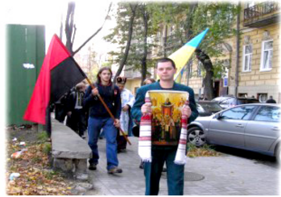
Рис. 2. Шествие колонны украинской молодежи с иконой, флагами Украины и ООН на Софийскую площадь, где у стен святой Софии Киевской был отслужен молебен к Пресвятой Богородице по случаю Праздника Покрова, Дня Украинского Казачества, 66-й годовщины образования УПА и Дня Украинского Оружия. Киев. 14 октября 2008 г. [8]

Знакомясь с материалами интернет-ресурсов о деятельности ПЦУ и УГКЦ, набравших в совре-