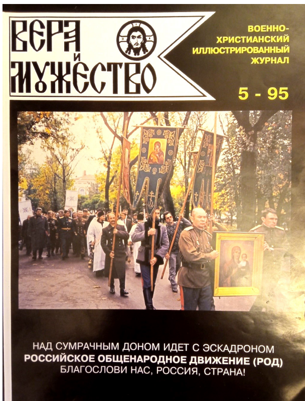
Рис. 3. Обложка журнала «Вера и мужество» (г. Москва). 1995. № 5.

Тир. 10 тыс. экз. Фото шествия членов Российского общенародного движения на Соборную площадь в г. Новочеркасске. 6 октября 1995 г.