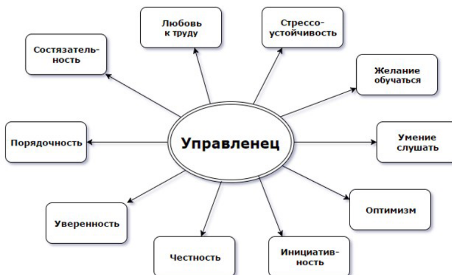
Рис. 2. Основные черты успешного управленца