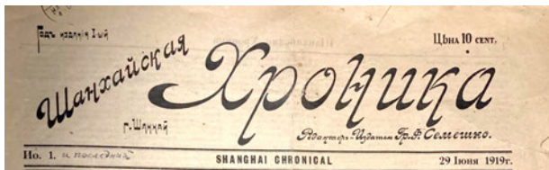
Рис. 1. Шапка газеты «Шанхайская хроника»

80 копий, остальные экземпляры, с большой вероятностью, были конфискованы полицией.