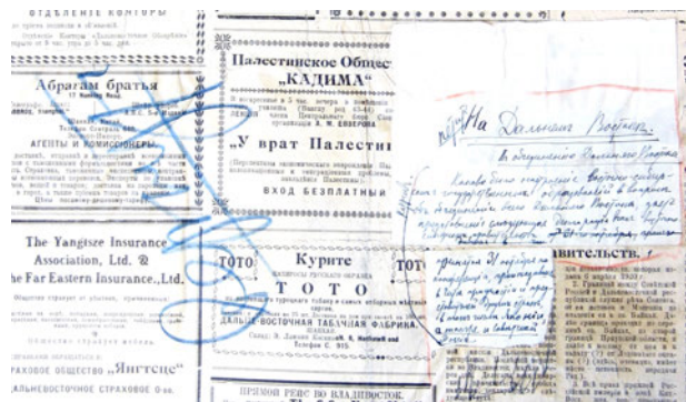
Рис. 5. Поправки в номере «Шанхайской жизни», хранящемся в Национальной библиотеке Чешской Республики Слева от поправки большими буквами написано «Вернуть [в редакцию?!]»

некоторые репортажи. Раздел «На Дальнем Востоке» зачеркнут крестом. Название репортажа «Верхбицкий кричит «банзай» зачеркнуто, внизу красным карандашом написана ироническая фраза «генерал-патриот!» (рис. 4).