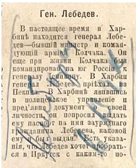
Рис. 3. Рукописные отметки в номере «Шанхайской жизни», хранящемся в РГБ Написано: «Выборка в ВЧК»

Что касается линии распространения газеты в Европу, то номера «Шанхайской жизни» поступали в РЗИА. Ныне эти номера находятся в Национальной библиотеке Чешской Республики и научной библиотеке ГА РФ. Чешская коллекция является самой полной. Согласно каталогу С. П. Постникова, РЗИА имел почти все номера «Шанхайской жизни» (кроме № 17–37, 305–360, 644–658) [4, с. 389].