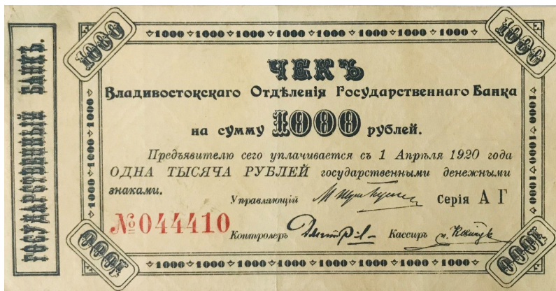
Рис. 1. 1000-рублевый чек Владивостокского отделения Государственного банка. Аверс (из личного архива автора)