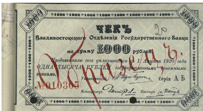
Рис. 2. Образец 1000-рублевого чека Владивостокского отделения Государственного банка. Аверс (ГАРФ. Ф. Р-198. Оп. 10. Д. 19. Л. 20)