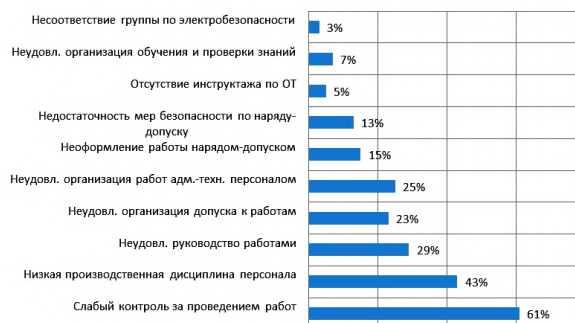
Рис. 6. Распределение организационных причин несчастных случаев, произошедших при эксплуатации электростанций, электрических сетей, тепловых установок и сетей и гидротехнических сооружений в 2023 г.

логии также являются причиной отказов. Несоблюдение регламентов и инструкций по эксплуатации и техническому обслуживанию оборудования, а также недостаточный уровень квалификации персонала, приводящий к неправильным действиям при обслуживании и эксплуатации, усугубляют ситуацию, повышая риск аварий. Эти причины зачастую взаимосвязаны и могут усугублять друг друга, что приводит к увеличению количества и серьезности аварий.