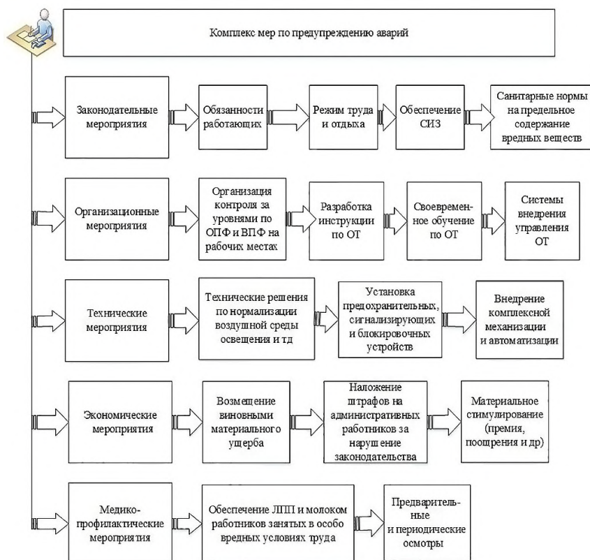
Рис. 1. Комплекс мер по поддержанию безаварийной работы основного технологического оборудования

гностика актуального состояния производственных процессов и оборудования, и потенциальные проблемы, связанные с их состоянием. Исходя из этого, возникает необходимость разработки тактики предотвращения производственных аварий и несчастных случаев.