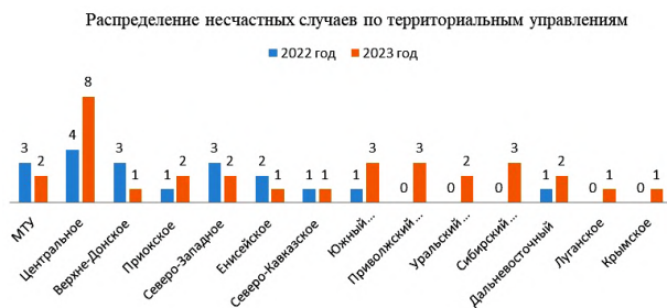
Рис. 4. Распределение аварий, произошедших при эксплуатации электростанций, электрических сетей, тепловых установок сетей и гидротехнических сооружений в 2022–2023 гг. по федеральным округам Российской Федерации

показателем аварийности, который достиг отметки в 30 % [9–11].