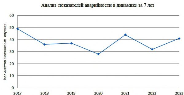
Рис. 3. Анализ показателей аварийности в динамике 2017–2023 гг.